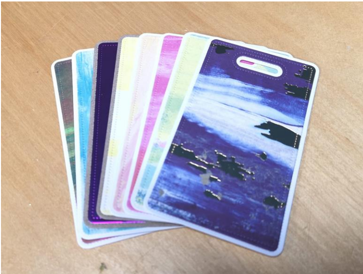
Billedet herover viser tagsne fra Simple and Basic SBD055