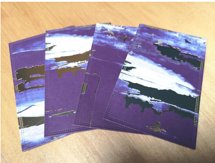
Billedet herover viser rektanglerne skåret med sættet SBD003